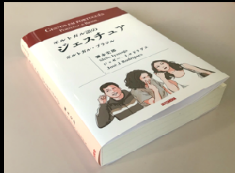
A5版に拡大 (2023) 480pp. 2023年2月改訂終了.